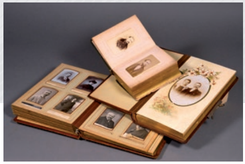
Albums de photographies familiales.