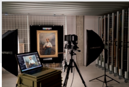
Campagne photographique dans les dépôts du musée.

Lors du festival Delémont'BD , tenu du 14 au 16 juin, un fragment original d'une frise visionnaire racontant l'histoire du Jura de la nuit des temps à aujourd'hui, découverte par le dessinateur de presse et bédéiste Pitch Comment, était visible au musée.