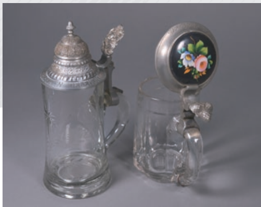
Deux verres à bière avec couvercle A. Halbeisen Delémont et Jul. Halbeisen.