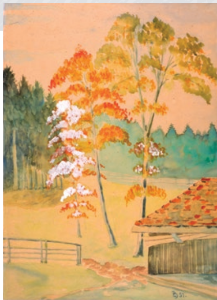
« Paysage », aquarelle de Laurent Boillat, 1951.