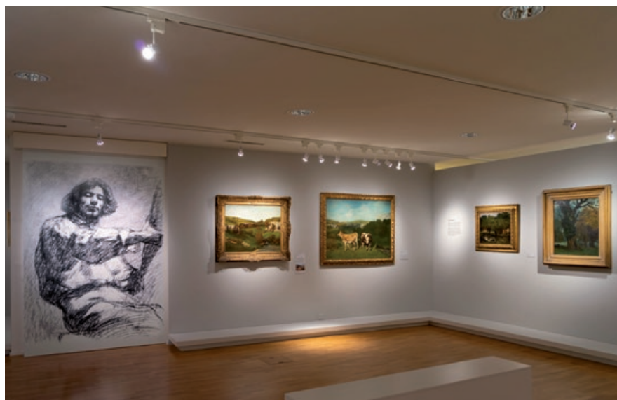
Vues de l'exposition Gustave Courbet. Le peintre et le territoire .