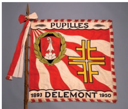
Drapeau de la société de gymnastique, section de Delémont.