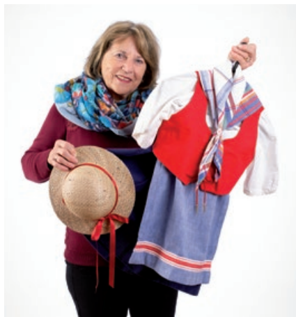
Costume jurassien campagnard pour fillette, réalisé par Josiane Jardin, 1980.