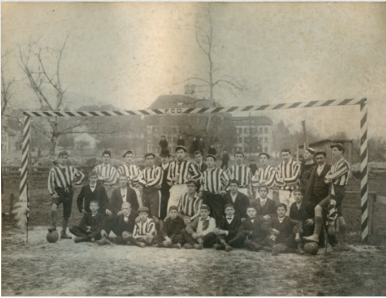
Football club de Delémont.