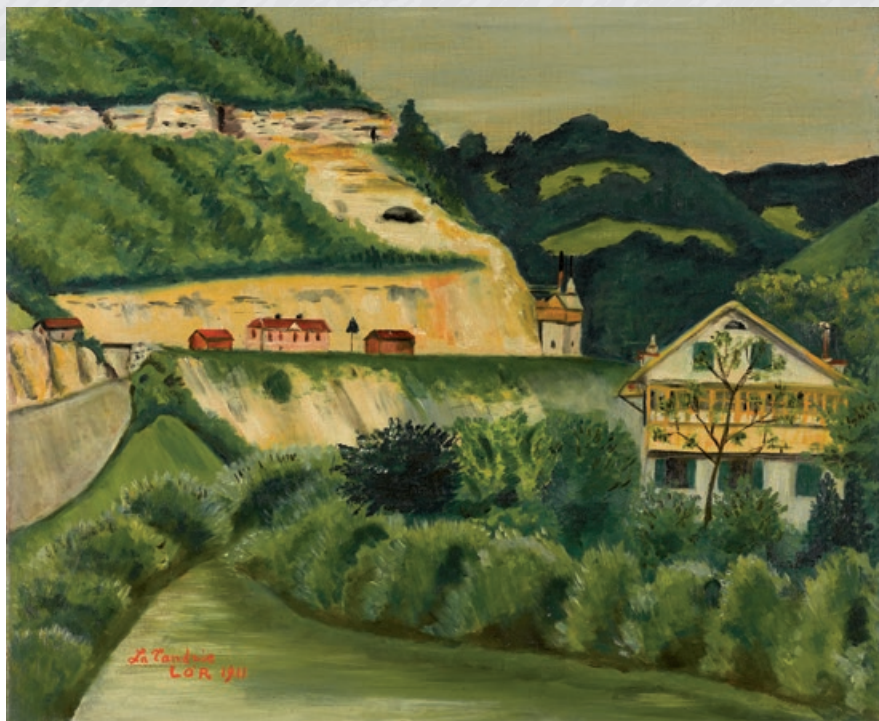
La Tandrie , huile sur toile de Lionel Radiguet, 1911.

Au nom du Musée jurassien d'art et d'histoire, je tiens à vous redire toute ma gratitude, chères corporations fondatrices, chers Amis du musée, donateurs, mécènes, collaborateurs, de votre confiance, de votre généreux soutien et de votre attachement à la sauvegarde et à la mise en valeur du patrimoine de notre région. Grâce à vous, nous pouvons œuvrer à la conservation et au rayonnement des pièces qui nous sont confiées.