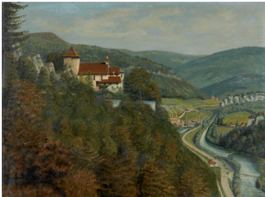
Le Vorbourg , huile sur toile, anonyme.