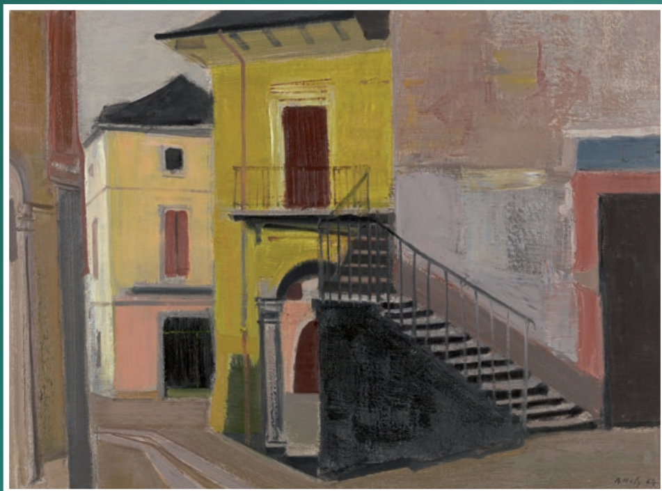
Village italien , huile sur toile d'Adrien Holy, 1964.