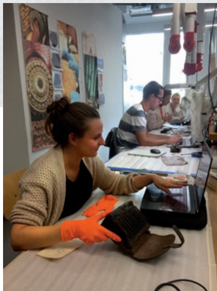
Des étudiants de la HE-Arc CR de Neuchâtel en train de restaurer des objets en cuir du musée.

Le projet de sauvegarde et de mise en valeur de 6000 photographes issus de la Collection Enard, soutenu par Memoriam, a été lancé. Un mandat a été confié à l'archéologue et historien Vincent Friedli pour nous appuyer dans ce travail de longue haleine. Une première étape a été menée de septembre à décembre : plus de 1000 bobines de films 24x36 noir-blanc et 3469 négatifs 4x5", 6x6 et 6x9 ont été visionnés, 2677 vues ont été alors sélectionnées puis numérisées en haute définition par l'Institut suisse pour la conservation de la photographie.