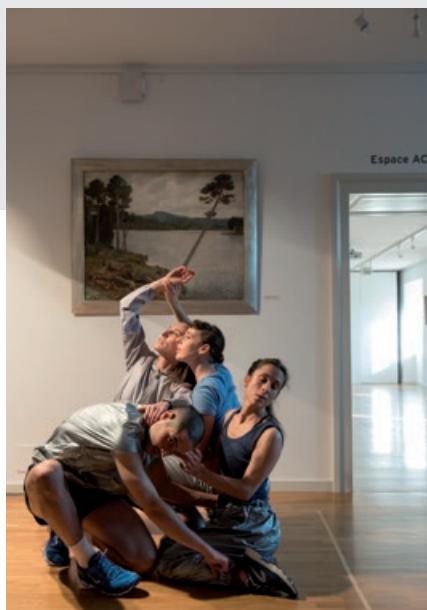
Suons! , spectacle en espaces d'exposition.