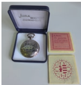
Montre de poche mécanique Raurica avec documentation, Jura Watch. Commémoration de l'entrée en souveraineté de la République et Canton du Jura en 1979.