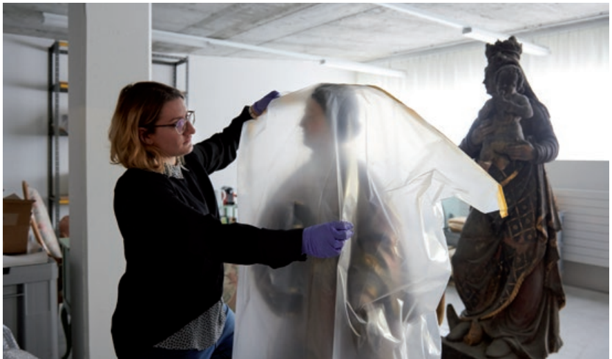
Mise en quarantaine d'une sculpture.