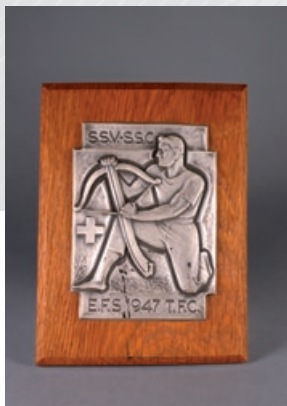
Plaque commémorative de la Société de Tir de Courfaivre, 1947.